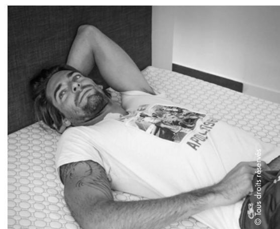
Le champion Camille Lacourt